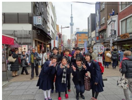
スカイツリーを背後に借りて・・・

1月19日(金曜日)、1年生は班行動による社会科見学に出かけました。浅草方面を中心に各班が行動計画を立てました。行動のスローガンは「I Love Tokyo 愛する東京について知ろう。協力し合う大切さを学ぼう。」けがやトラブルもなく、ほぼ計画どおりにできました。良き思い出と東京への愛着が一層増した一日でした。