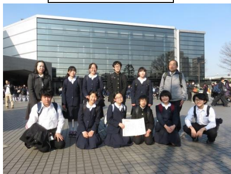
ホールの前で記念撮影