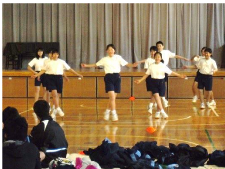
グループ発表の様子